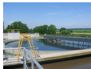
Présenter le mode traitement des eaux usées et des boues.