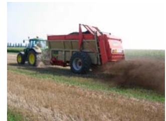
Préciser les doses maximales d'épandage.