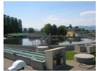
Expliquer l'origine des boues.

Il doit lui exposer succinctement la réglementation spécifique à l'épandage agricole. Il insiste sur les points qui ont des répercussions pour l'Agriculteur :