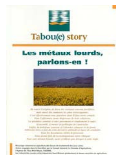
Présenter les supports d'information Tabou(e) story.

Charte qualité départementale relative à l'épandage agricole des boues, effluents et compost de boues. Action résultant de la concertation des acteurs haut-rhinois : Maîtres d'Ouvrages, Agrivalor, SAUR, SEDE Environnement, Terralys, Transporteurs, Prestataires d'Épandage, Agriculteurs, Mission Recyclage Agricole, Conseil Général, Agence de l'Eau Rhin Meuse, Chambre d'Agriculture, ADEME et Services de l'Etat.