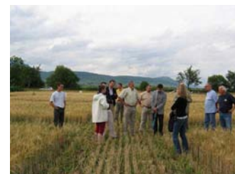
Faire connaître les différents intervenants de la filière de recyclage agricole des boues.