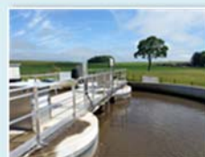
Stations (STEU) boues activées – aération prolongée